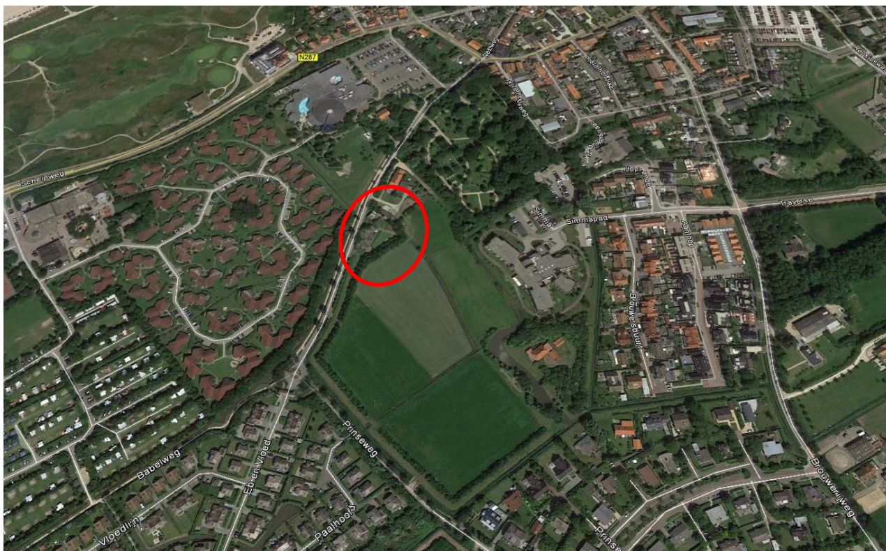
Fig. 1. Ligging van het plangebied [rode cirkel ]

Aan de hand van bestaande gegevens en een natuurscan ter plaatse is een helder beeld ontstaan van de flora en fauna in het plangebied en de naaste omgeving.